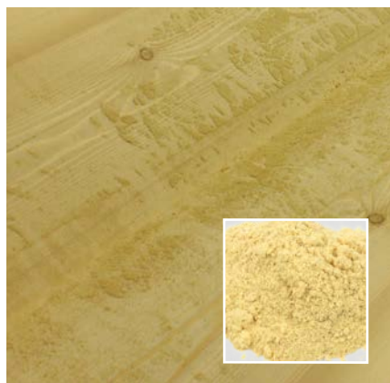
Incidenza della polvere con sega standard