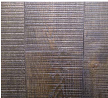
Sezione di una superficie finita