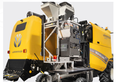
HarvestMaster 性能强大的称重系统 Twin H2, 可提供精确的称量、湿度和体积重量数据