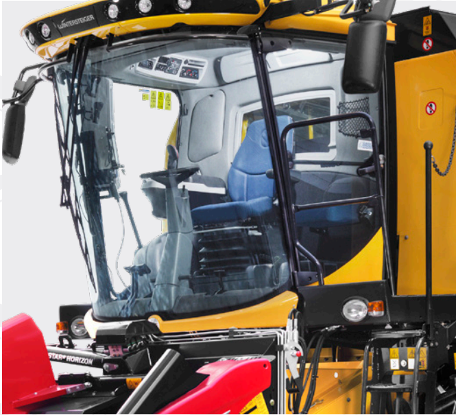
符合人体工程学的操作方法