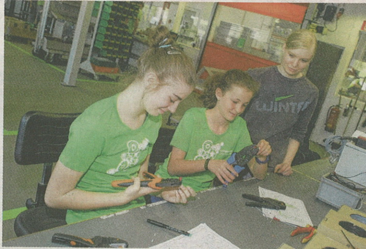
In der Elektrowerkstätte und in der Montage durften die Schülerinnen bei der Firma Wintersteiger ihr technisches Geschick zeigen.

RIED. Technische Berufe sind längst keine Männerdomäne mehr. 1800 Mädchen waren anlässlich des „Girls' Day“ in Betrieben, um Technikluft zu schnuppern. Acht davon besuchten die Firma Wintersteiger in Ried.