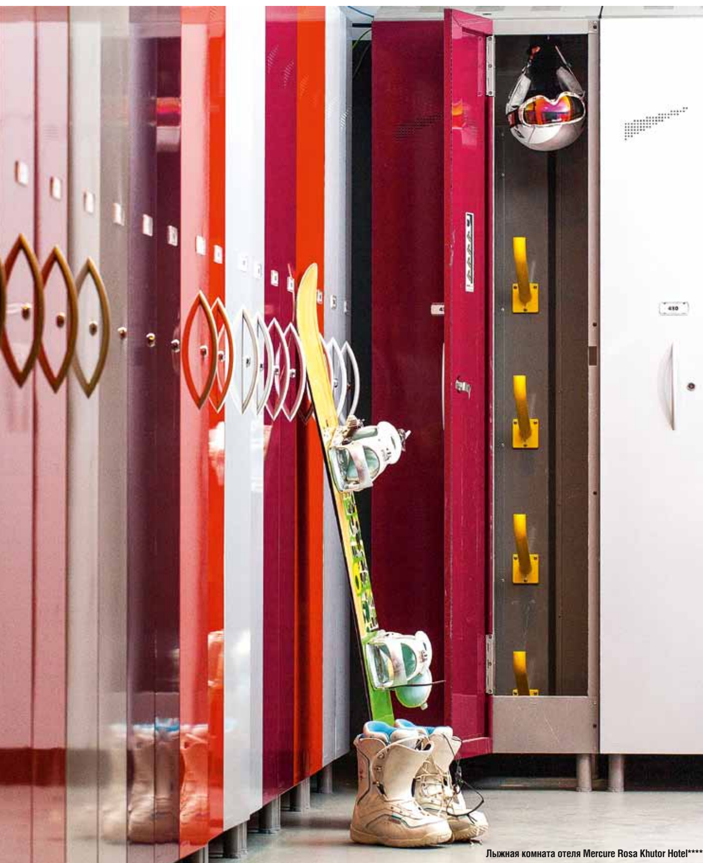
Лыжная комната отеля Mercure Rosa Khutor Hotel****