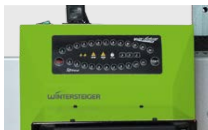
Simplicité de la commande

Un support (en option) est disponible s'il n'y a pas d'espace disponible sur un mur pour fixer la Wax Future. Le support est composé d'un ensemble de 3 pieds métalliques et de bras de support. (Code article : 55115553)