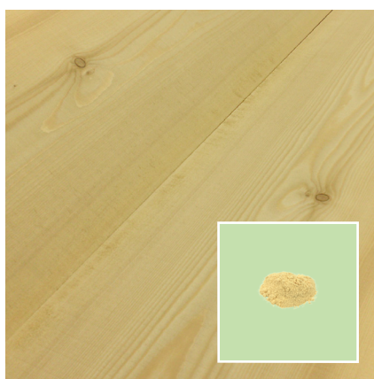
powstały pył - piła DSB X-Clean

Aż do 92 % mniej pyłu z piłą DSB X-Clean!