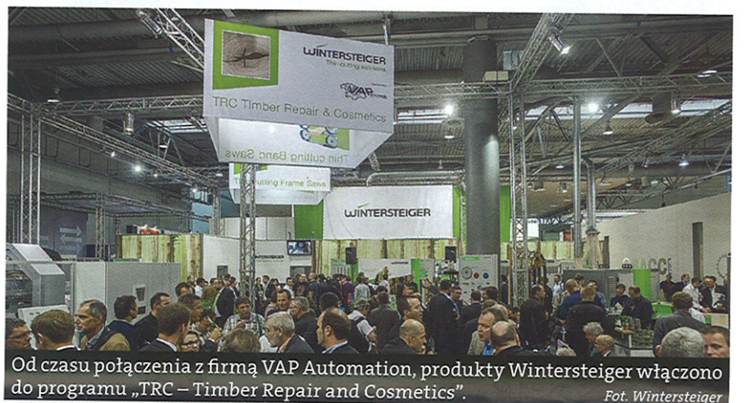
Od czasu połączenia z firmą VAP Automation, produkty Wintersteiger włączono do programu „TRC – Timber Repair and Cosmetics”.