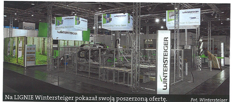
Na LIGNIE Wintersteiger pokazał swoją poszerzoną ofertę.

Dzięki specjalnemu procesowi produkcji, rozwierania zębów i hartowania, piły zapewniają doskonałe rezultaty przy maksymalnej jakości i efektywności cięcia. Ponadto pracownicy firmy Wintersteiger służą kompleksową pomocą – od wyboru surowca, poprzez planowanie, wykonanie i kontrolę produkcji, aż do wytyki gotowego do użycia produktu.