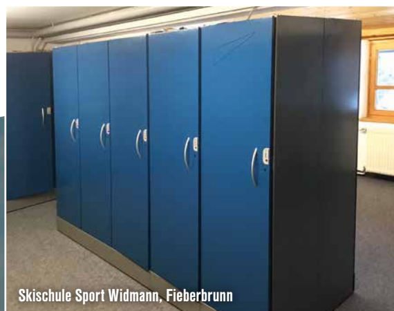
Skischule Sport Widmann, Fieberbrunn