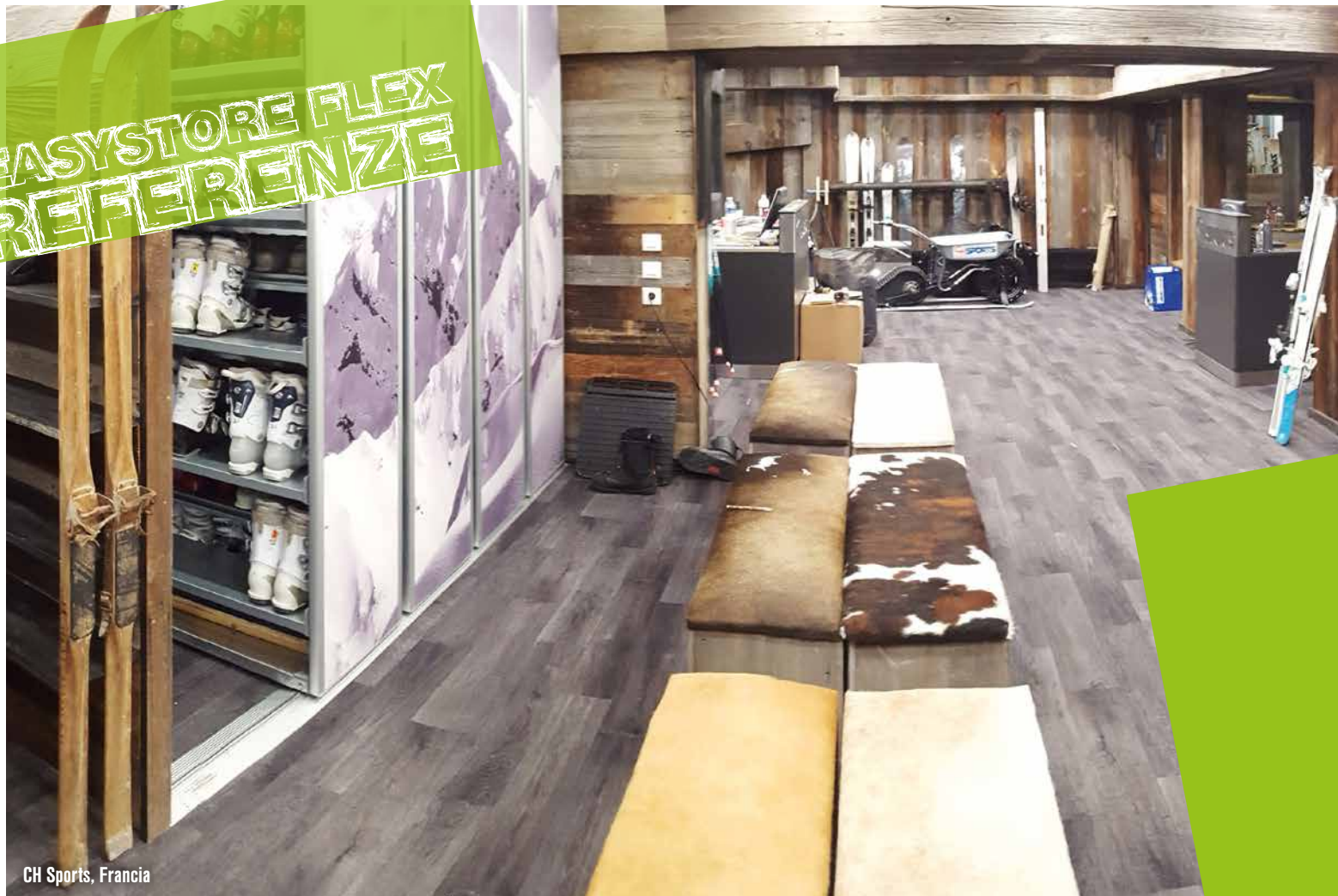
CH Sports, Francia