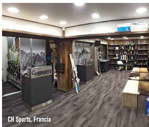
CH Sports, Francia