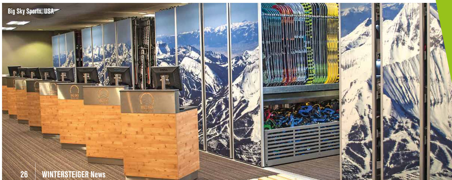
Big Sky Sports, USA