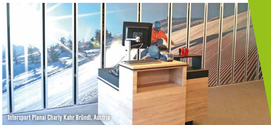
Intersport Planai Charly Kahr Bründl, Austria