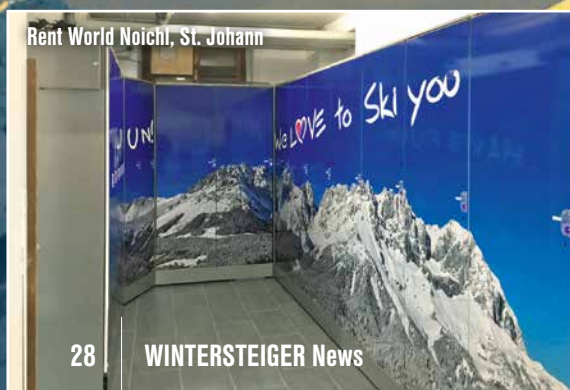
Rent World Noichl, St. Johann