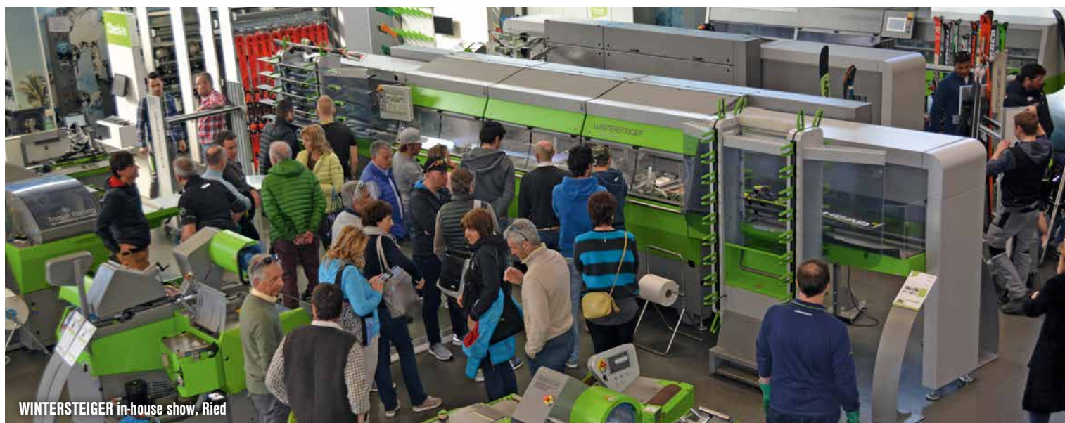
WINTERSTEIGER in-house show, Ried

Nel 2017 WINTERSTEIGER ha partecipato a 13 fiere in tutto il mondo, dagli Stati Uniti all'Europa fino alla Cina.