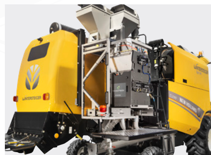
Высокоэффективная система взвешивания Twin H2 от HarvestMaster, обеспечивающая точные показатели массы, влажности и объемной массы