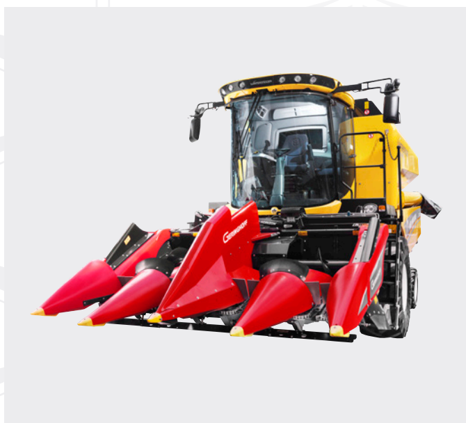
Точное разделение механизма на две половины — от жатки до решета